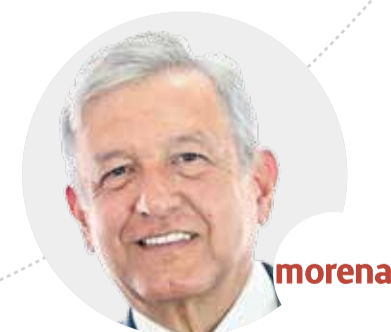
Andrés Manuel López Obrador (Morena) 50,000