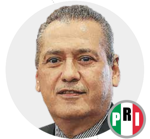
Manlio Fabio Beltrones (PRI) 61,855