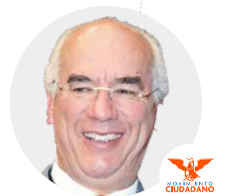
Dante Delgado (Movimiento Ciudadano) Alrededor de 55,000