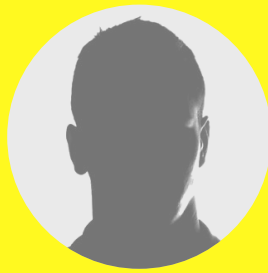
Pedro Díaz Parada El Capo del Istmo

La organización criminal del narcotráfico, denominada Cártel Díaz Parada , de Oaxaca o del Istmo, fue fundada en los años 70 por Pedro Díaz Parada y sus hermanos: Eugenio Jesús y Domingo Aniceto