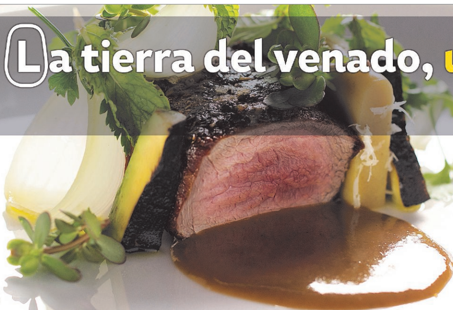
Corazón de filete de venado

La tierra del venado, una delicia maya Experiencias Infinitas