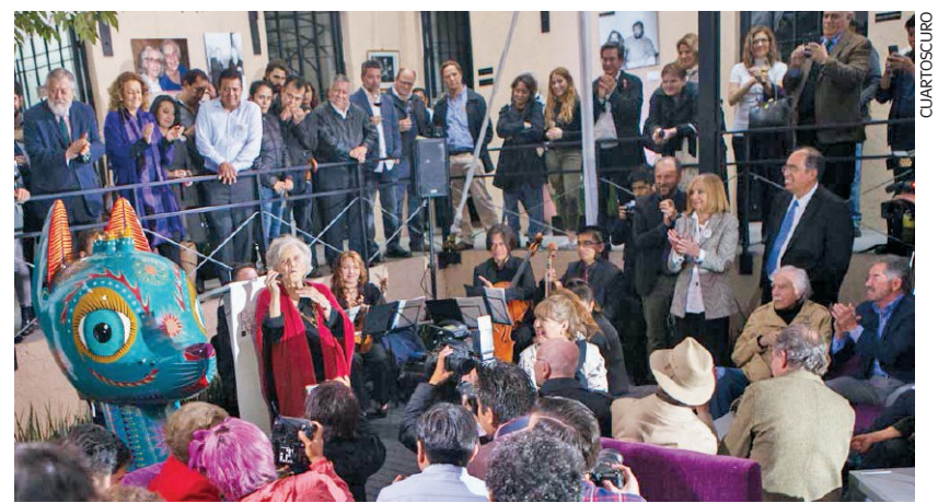
La escritora Elena Poniatowska celebró que el nuevo espacio cultural acercará a los niños a la literatura, al arte y al periodismo.

"Elena es una de las figuras más emblemáticas y fundamentales de nuestro tiempo, es tan emblemática que realmente cuesta trabajo describirla o definirla. No sólo es emblemática y fundamental por su obra lite-