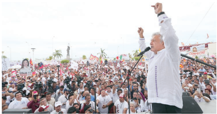
Andrés Manuel López Obrador, en Cd. del Carmen Campeche

Con la convicción de que las campañas ya terminaron y la elección está resuelta a su favor, hoy el candidato presidencial de Morena, Andrés Manuel López Obrador , inicia los cierres de su campaña. Nos dicen que don Andrés cerrará en varias ciudades del país. El tabasqueño comenzará en Colima, Jiquiplan y Zamora, estos dos últimos en Michoacán. Nos comentan que AMLO tendrá de tres a cuatro cierres diarios para abarcar lo más posible. Como muchos toreros o cantantes, López Obrador tendrá muchas giras de despedida de su tercer intento por llegar a la Presidencia de la República, que según él será la vencida.