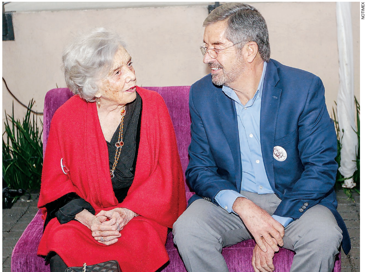
Juan Ramón de la Fuente, presidente honorario de la Fundación Elena Poniatowska, asistió a la inauguración del lugar.