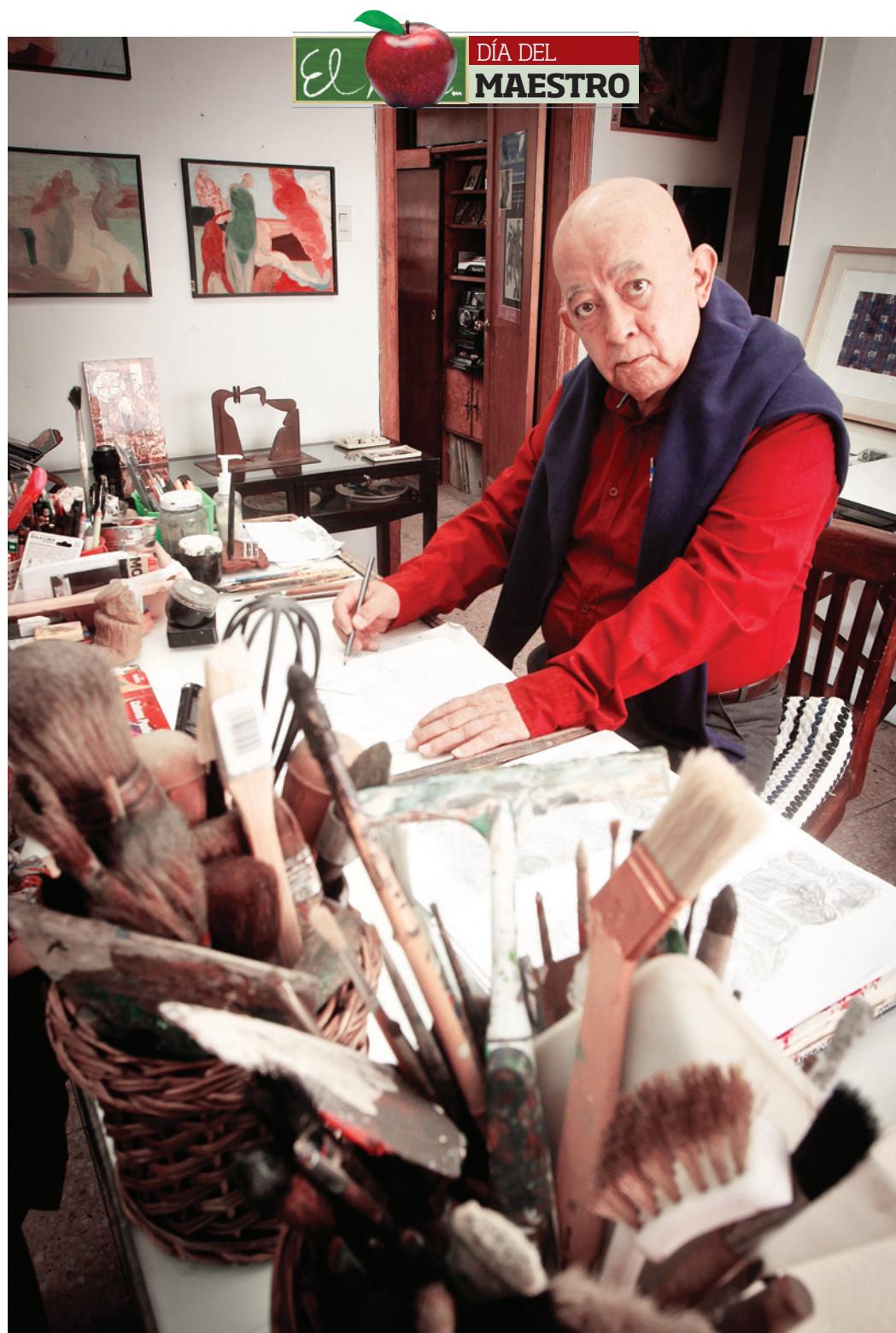
ESTUDIO. El maestro pinta en una casa de la colonia Roma desde hace unos 40 años