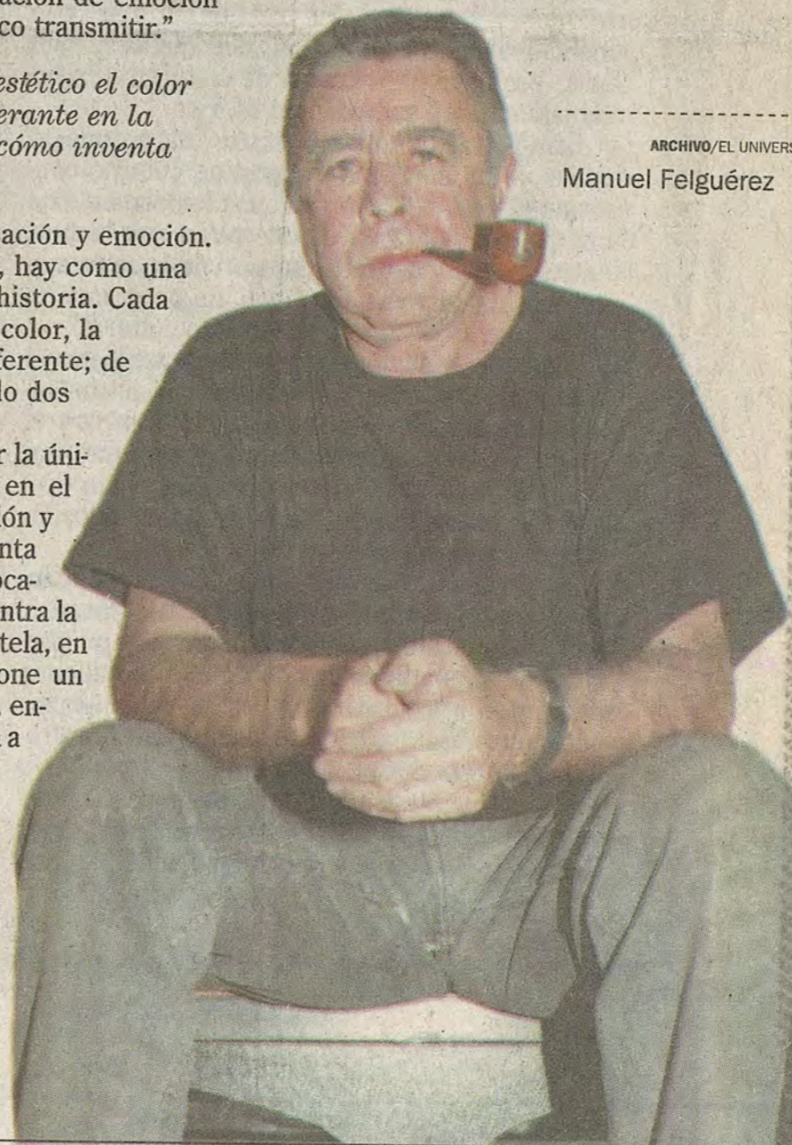
Manuel Felguérez

todo tiene un orden. Y una vez que se termina el cuadro ya no se puede quitar ni poner nada. En ese momento se siente una gran emoción, se firma y sólo se espera a que el espectador sienta la misma emoción que uno tuvo al terminarlo.”