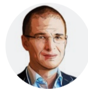
Ricardo Anaya Cortés (PAN-PRD-MC)