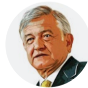
Andrés Manuel López Obrador (Morena-PT-PES)