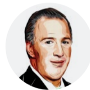
José Antonio Meade Kuribreña (PRI-PVEM-Panal)