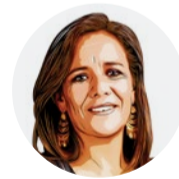
Margarita Zavala (Independiente)