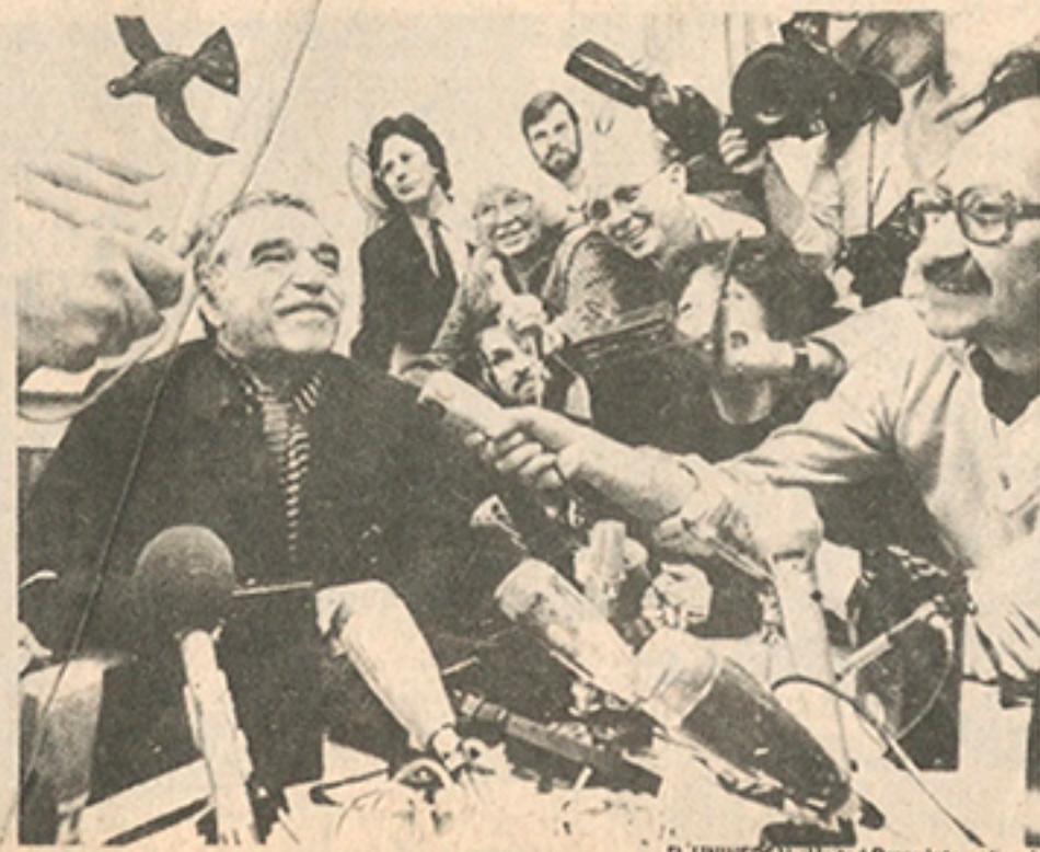
Gabriel García Márquez, Premio Nobel de Literatura 1982, ofreció una conferencia de prensa a su llegada a Estocolmo para recibir la presea